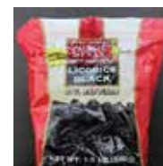
NO LO COMA PUUEDE COMERLO 5 Aussie-Style Lucky Country Soft Licorice 'Traditional Black' 98% Fat Free