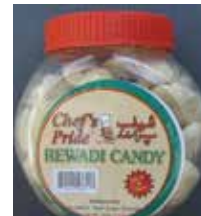
Chef's Pride Rewadi Candy de Pakistan Retirado: 3/5/12