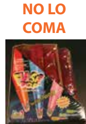
Flash Pop Candy by Kidsmania 4