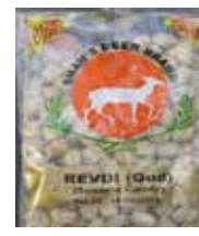
Shah's Deer una marca de India Revdi (Gud) (Sesame Candy) Retirado: 3/5/12