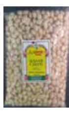
Sesame Candies Retirado: 10/7/13