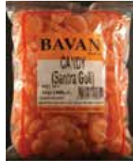
Santra Goli Retirado: 1/28/11