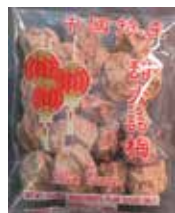
Red Lantern Plum Candy de China Retirado: 10/16/12