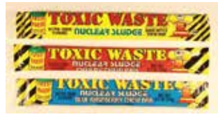
"Toxic Waste" brand "Nuclear Sludge Bar" (Sabores diferentes) 3 Retirado: 1/14/11

Ultima Fecha de Actualización: 9 de noviembre 2013 2