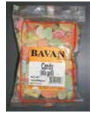
Mix Goli Retirado: 12/1/11