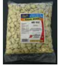
Jyoti Indian Sweets Bonbons Indiens Sugar Rewdi Retirado: 11/17/11