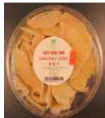
Dulce de Jengibre de Vietnam Retirado: 8/5/13