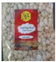
Rewari Sugar-Round Candy Retirado: 2/23/12