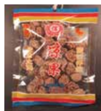
Dried Plum de Hong Kong Retirado: 11/5/12