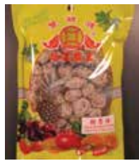
Sweet & Soure Prune de Taiwan Retirado: 11/5/12