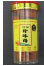
Preserved Plum de China Retirado: 11/5/12