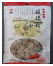
Ching Ling Dried Prune de Taiwan Retirado: 11/5/12