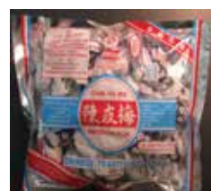
Chan Pui Mui Preserved Plum de Hong Kong Retirado: 10/16/12