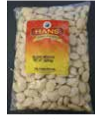
Sugar Rewari Retirado: 11/17/11