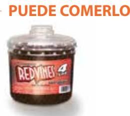
PUUEDE COMERLO 7 Red Vines 4lb Black Licorice en Jarra