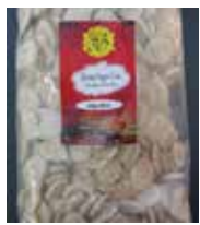
HB una marca de India Rewari Sugar-Coin Candy Retirado: 2/23/12