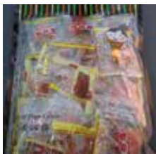
Gold Plum Candy de Taiwan Retirado: 7/20/12