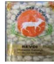
Revdi (Sesame Candy) Retirado: 3/5/12