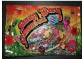
Bee Brand Sunny Day Gummies Retirado: 12/1/11