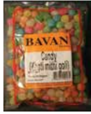
BAVAN una marca de India Khati Mithi Goli Retirado: 1/28/11