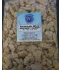
Punjab Bazaar de India Rewari Gur Jaggery Retirado: 11/17/11