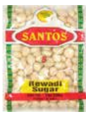
Rewadi Sugar Retirado: 9/13/13