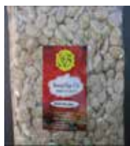
Rewari Gur-Flat (Jaggery Candy) Retirado: 2/16/12