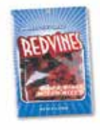
8oz Mixed Bites en Bolsa Colgante

Para preguntas o más información favor de ponerse en contacto con el Departamento de Salud Pública del Condado de Los Angeles: