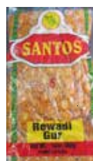
Santos Dulces de India Rewadi Gur Retirado: 9/13/13