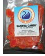
Hans una marca de India Santra Candy Retirado: 3/24/11