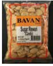
Sugar Rewari Retirado: 6/30/11