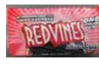
1lb Black Licorice Twists