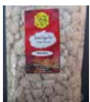
Rewari Sugar-Flat Candy Retirado: 2/23/12