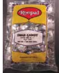
Roopal Swad Candy de India Retirado: 11/18/11