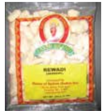
Laxmi Brand Rewadi (Jaggery) de India Retirado: 2/16/12