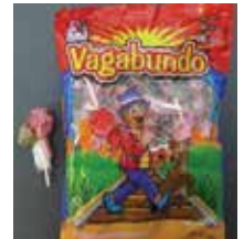
Vagabundo Paletas de Mexico Retirado: 3/30/12