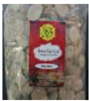
Rewari Gur-Coin (Jaggery Candy) Retirado: 2/23/12