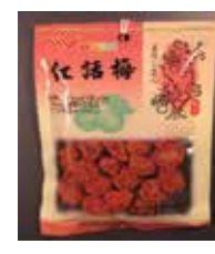
Dried Red Prune de Taiwan Retirado: 11/5/12