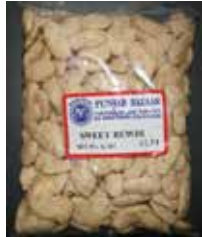
Sweet Rewdi Retirado: 11/17/11