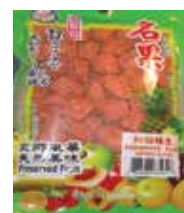
Sanh Yuan Preserved Plum de Taiwan Retirado: 10/16/12